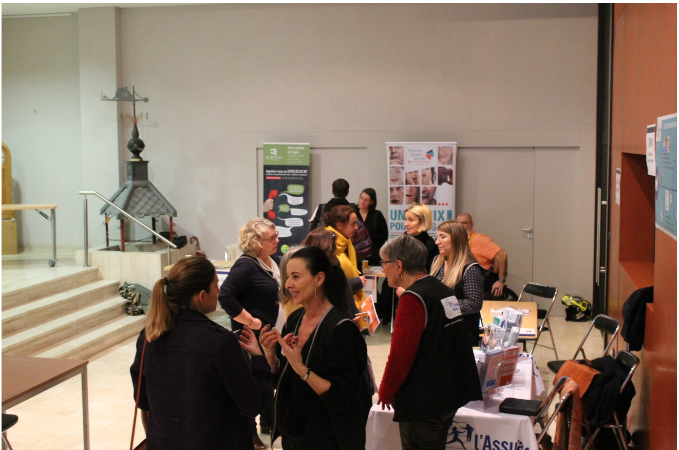
Stand à l'AGORA de la plateforme territoriale d'appui sur les rencontres autour des parcours de santé