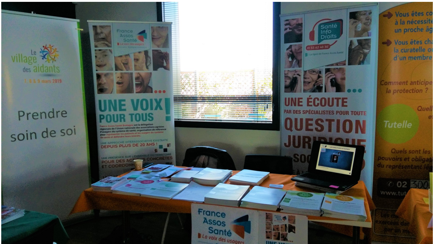
Stand au Village des Aidants en Mars 2019